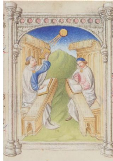
Gebroeders van Lymborch, Bible Moralisee. Afbeeldingen die te zien zijn in de expositie Universum Van Lymborch.