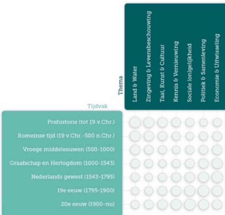
De door Erfgoed Gelderland ontwikkelde matrix van Gelderse Verhaallijnen.

Erfgoed Gelderland heeft ook een belangrijke rol gehad in de implementatie en uitvoering van het 'Verhaal van Gelderland', waarbij ze een verhaal van Gelderland matrix hebben ontwikkeld. Op de knooppunten die verbonden zijn aan de verhaallijn 'Graafschap en Hertogdom' speelt het Gebroeders Van Lymborch Huis vanzelfsprekend een belangrijke rol.