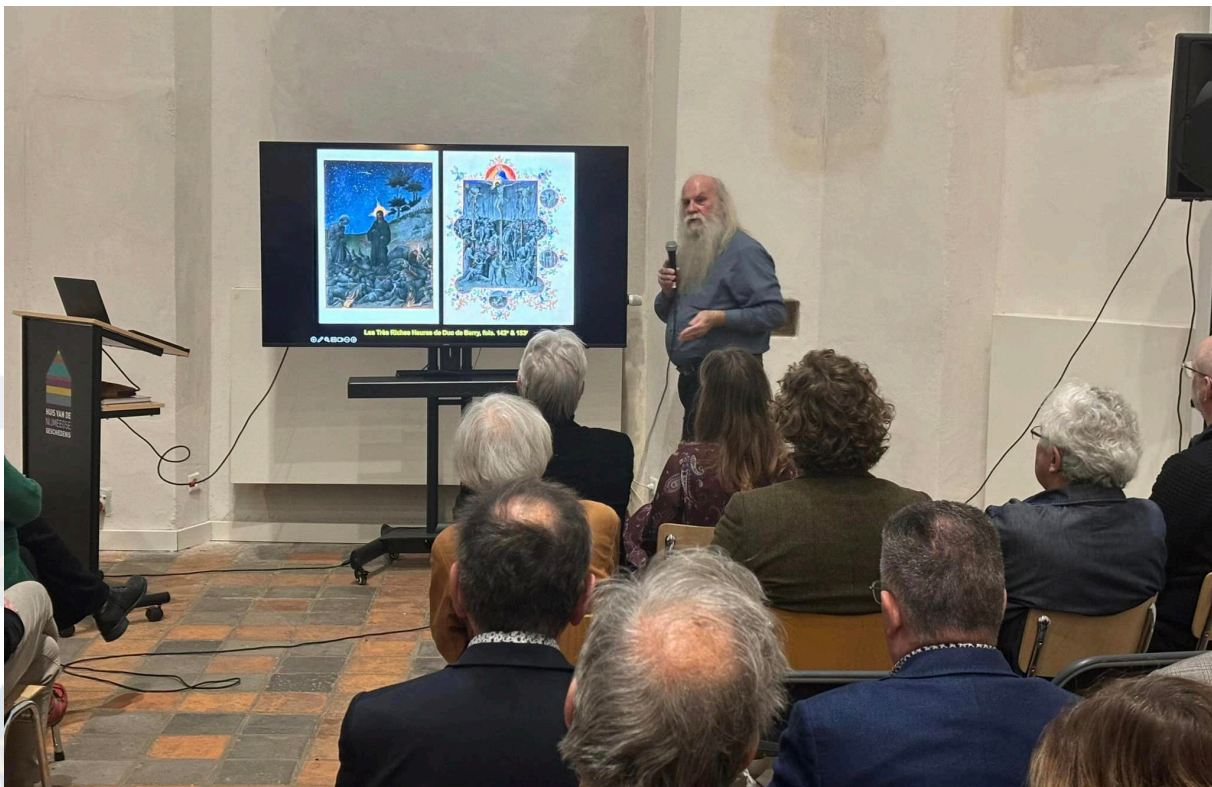
De jaarlijkse nieuwjaarsbijeenkomst van 't Geselschap vond in 2023 plaats in de Mariënburghkapel

Door, naast de eigen inkomsten en subsidies, in te zetten op sponsoring en fondsenwerving in de private sector beogen we onze inkomsten stromen te diversifiëren en daarmee een financieel stabielere en minder afhankelijke situatie te bereiken. Hiermee beogen we tevens een deel van de in de subsidievoorwaarden genoemde cofinanciering te regelen.