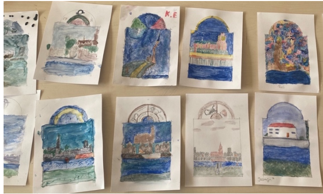
Links: Een schoolklas op bezoek in het Gebroeders van Lymborch Huis. Rechts: Werk van brugklassers van het Karel de Grote College geïnspieerd door de Van Lymborchs.