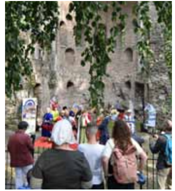
Activiteiten van de Stichting Maelwael Van Lymborch in 2020 en 2021

In 2019 heeft de stichting zich gefocust op het lanceren van het Gebroeders Van Lymborch Huis, zodat wij vanaf 2020 volop actief zouden kunnen zijn als organisatie met een jaarrond cultureel en educatief programma met behoud van een festival in wisselende gedaantes. Deze transitie werd bemoeilijkt door de coronacrisis maar desondanks doorgezet. In de moeilijke jaren die achter ons liggen wist het Gebroeders Van Lymborch Huis zich toch duidelijk te positioneren en haar openingstijden en eigen inkomsten uit omzet en sponsoring flink te verruimen. Het Gebroeders Van Lymborch Festival keerde terug in een nieuwe vorm waarin onze kernwaarden (zie missie & visie) meer centraal zijn komen te staan.