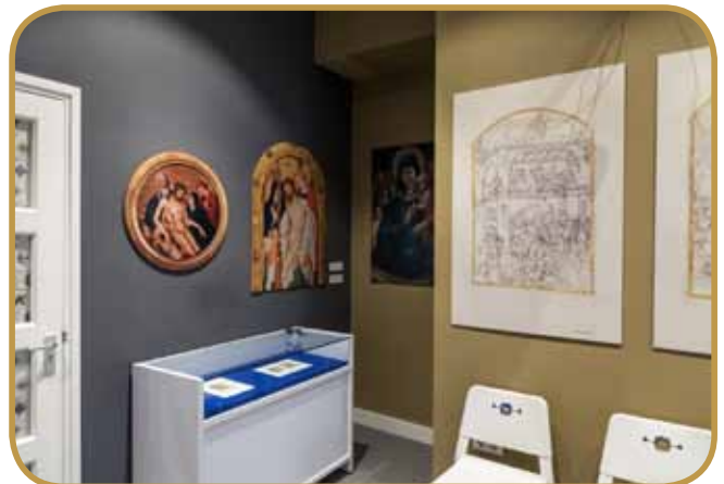
Een impressie van de huidige inrichting van het Gebroeders Van Lymborch Huis.